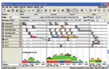
Produktionen planeras i ett överskådligt grafiskt gränssnitt.

“ Med Novotek MES optimerar du din produktionsprocess. Tack vare att varje operatörsplats får sin egen skräddarsydda MES-konfiguration blir systemet mycket lätthanterligt och överskådligt.