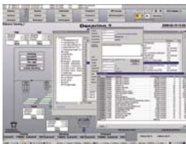
Med Novotek MES byggs recepten upp processteg för processteg enligt de riktlinjer som systemet ger.

Novotek MES är ett komplett system för dosering, blandning, efterbehandling samt av transporter i anläggningar. Allt sker med precision, repeterbarhet och med full spårbarhet. Novotek MES kan konfigureras på många olika sätt och anpassas helt till de lokala förutsättningarna. I systemet finns Novoteks samlade erfarenheter inom producerande industri. Detta är en garanti för att du skall få din produktion att lyfta till nya nivåer.