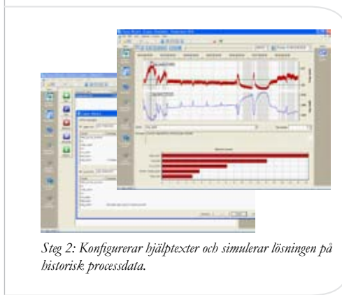
Steg 2: Konfigurerar hjälptexter och simulerar lösningen på historisk processdata.

Nu kan lösningen simuleras på historisk processdata. Det vill säga man kan spela upp ett historiskt scenario och se när och vilka råd Cause+ skulle ha gett en operatör.