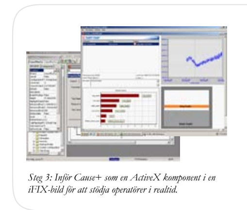
Steg 3: Inför Cause+ som en ActiveX komponent i en iFIX-bild för att stödja operatörer i realtid.

jämför med det "normala". Så länge som processens fingeravtryck stämmer med det "normala" fingeravtrycket händer inget men när en avvikelse uppstår talar Cause+ direkt om för en operatör vad som är orsaken och vad som bör göras för att återgå till ett normalt tillstånd.